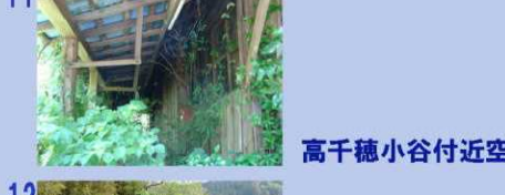
高千穂小谷付近空屋