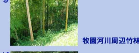
牧園河川周辺竹林