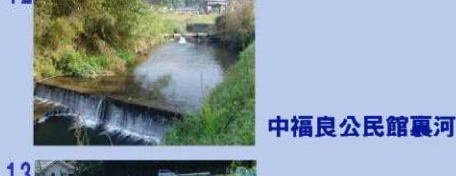
中福良公民館裏河川