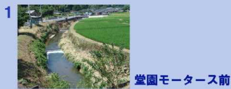
堂園モーターズ前